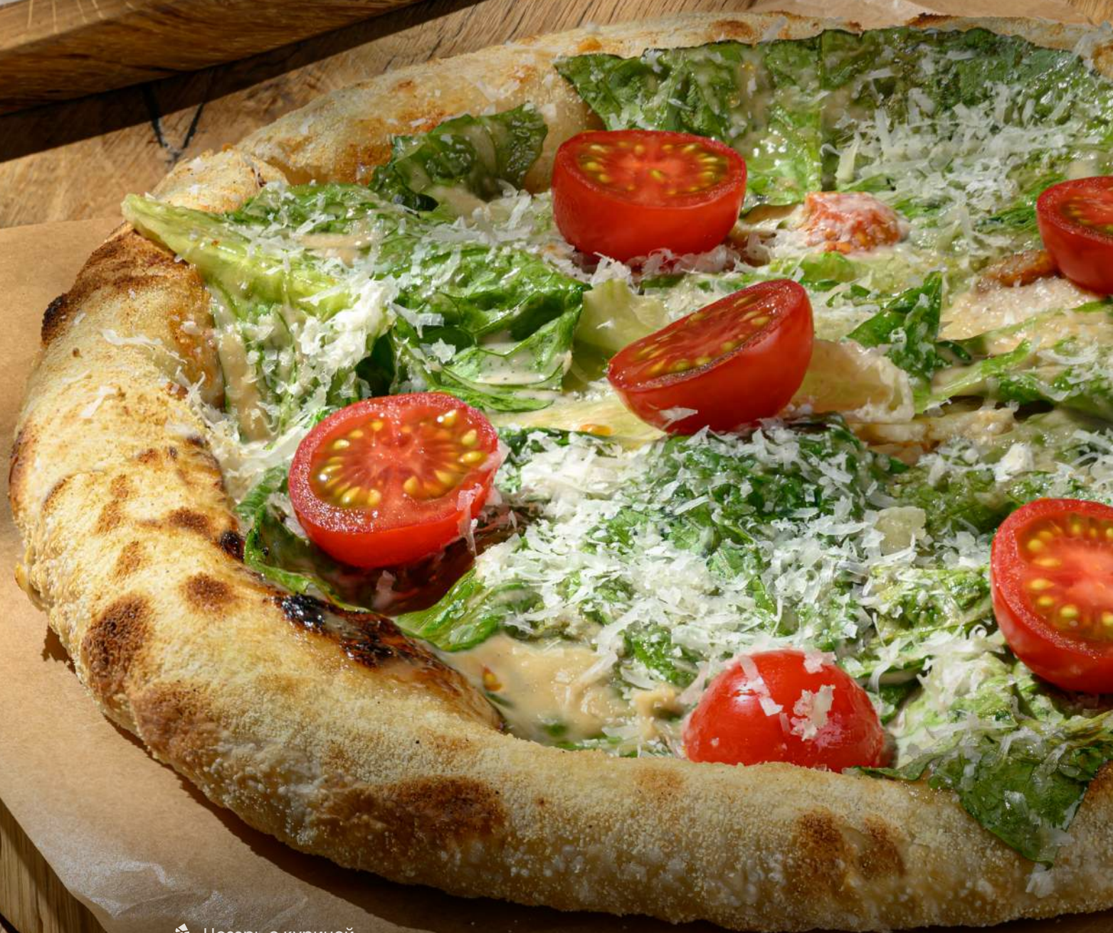
Цезарь с курицей