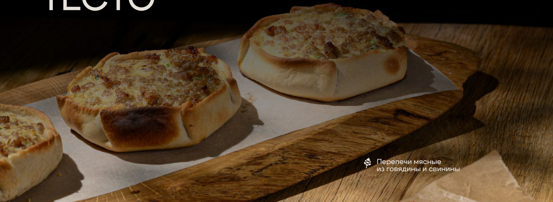
Перепечи мясные из говядины и свинины