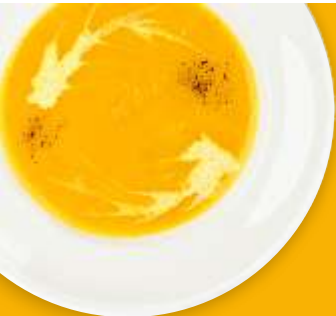
Крем-суп овощной с семгой

Дорогие гости, если у вас есть аллергия на какой-либо продукт, пожалуйста, сообщите об этом официанту