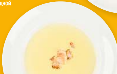
Сырный суп с тигровыми креветками