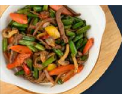
Говядина с припущенными овощами

Дорогие гости, если у вас есть аллергия на какой-либо продукт, пожалуйста, сообщите об этом официанту