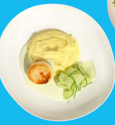
Куриная котлета с картофельным пюре и свежим огурцом