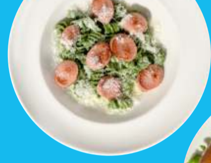
Зеленые макарошки с сосисками