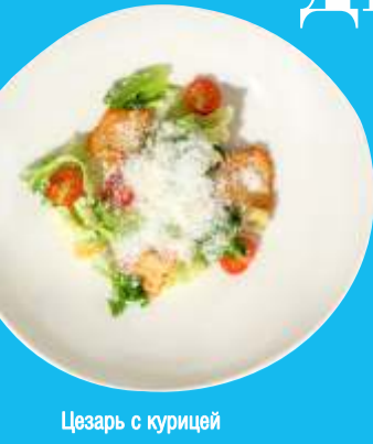
Цезарь с курицей