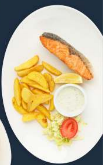
Семга на гриле с запеченным картофелем