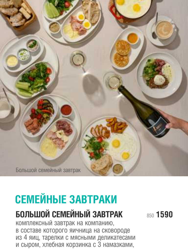
Большой семейный завтрак