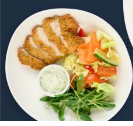
Куриное филе в панировке с пикантным салатом